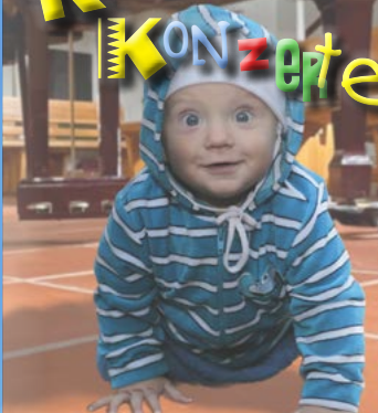
Nachfolge-Christi-Kirche Dietrich-Bonhoeffer-Straße im Beueler Süden

Live-Musik für die Aller kleinsten und ihre Eltern (oder Tagesmütter): Am zweiten Donnerstag im Monat um 11 Uhr in der Nachfolge-Christi-Kirche, Dietrich-Bonhoeffer-Straße.